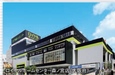
ロイヤルホームセンター森ノ宮店(大阪府)

個性豊かなファミリーライフを応援するため、関西・関東を中心に61ヶ所で展開。インテリアやメンテナンスなど、より快適な住まいづくりのノウハウをご提案します。