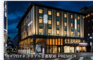
ダイワロイネットホテル京都駅前 PREMIER

ビジネスにレジャーに、みなさまがホテルを安心・快適にご利用いただけるよう、サービスを一から見つめなおし、全国各地でお待ちしております。