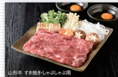
山形牛 すき焼きしゃぶしゃぶ用

さまざまなラインアップの中から、お好きなグルメ商品をお選びいただけます。全国より集めたこだわりの品を存分にご堪能ください。