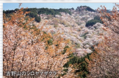
吉野山のソノヤマザクラ

世界遺産でもあり国立公園にも指定されている、奈良県・吉野山の約3万本の桜保全活動にご協力ください。苗木育成・植樹等に活用させていただきます。