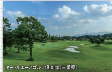
タートルエースゴルフ倶楽部(三重県)

豊かな自然に恵まれた直営ゴルフ場を全国10ヶ所で展開。ベテランゴルファーからビジターゴルファーまで様々な年代の方にお楽しみいただけるコースをご堪能ください。