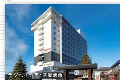
ラ・ジェントステイ函館駅前

遊び心あふれるユニークなデザインの宿泊特化型ホテル。グループでの楽しい旅の思い出に、またビジネスにも大変便利なホテルです。